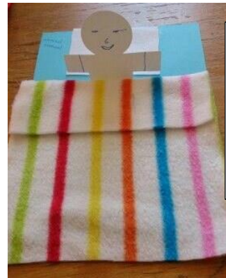
Maak vir Samuel in sy bedjie. Jy kan 'n vuurhoutjie boksie ook gebruik.