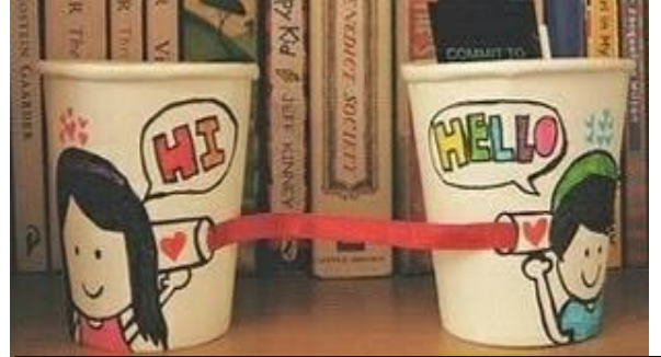
Maak telefoontjies uit polisterien glases en tou/wol